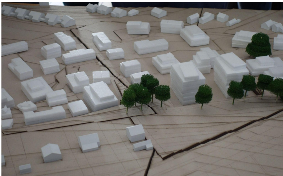
Exemple de répartition des hauteurs