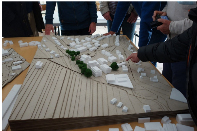
Discussions autour de la maquette