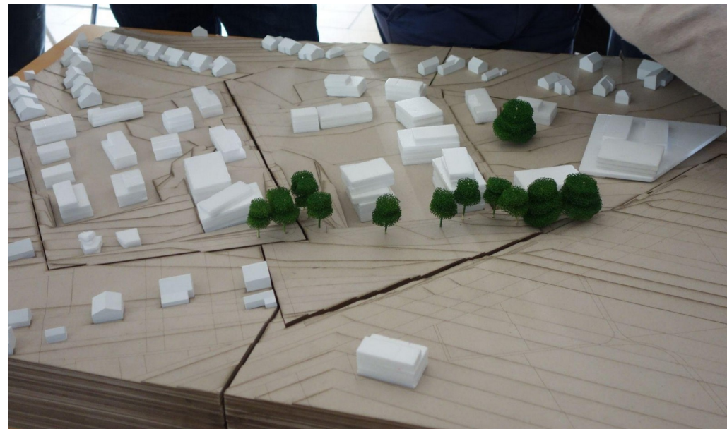
Exemple de répartition des hauteurs