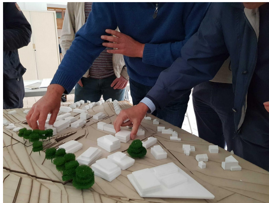
Un espace réservé au centre (type place publique)

Cette idée est plébiscitée par le groupe de travail : il s'agit de créer des espaces publics végétalisés, de rencontre, pour éviter un effet de plein qui desservirait la qualité dans le quartier et pour ses environs. Il est également important de conserver les coulées vertes existantes.