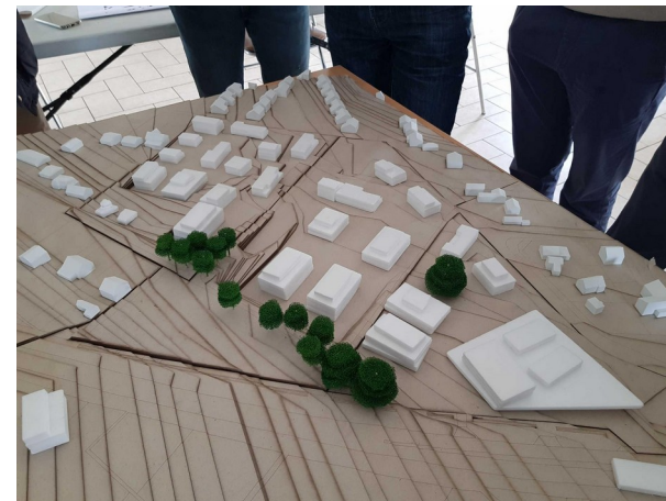
Bâti avec des hauteurs ne dépassant pas le R+2+attique le long du chemin des Grands Heurts