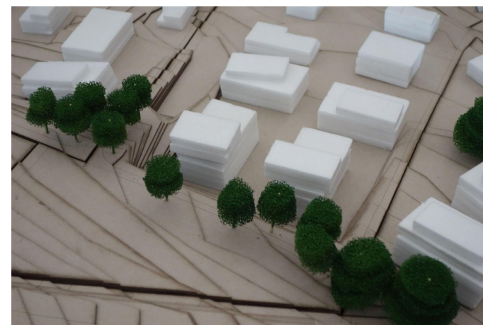
Bâti avec des hauteurs dépassant le R+2+attique le long du chemin des Grands Heurts